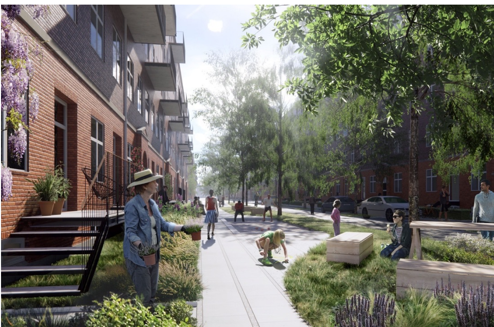
Kreditering: JAJA Architects

Vi foreslår, at der anlægges en test på 5 mindre veje eller sidegader fordelt på Østerbro. Hvis de frigivne områder bliver benyttet af lokale Østerbroborger, mens der ikke skabes betydelige trafikaleudfordringer, kan projektet udvides til flere veje. Succeskriterierne er flere grønne områder på den frigivne plads, færre trafikuheld og større glæde for de lokale.