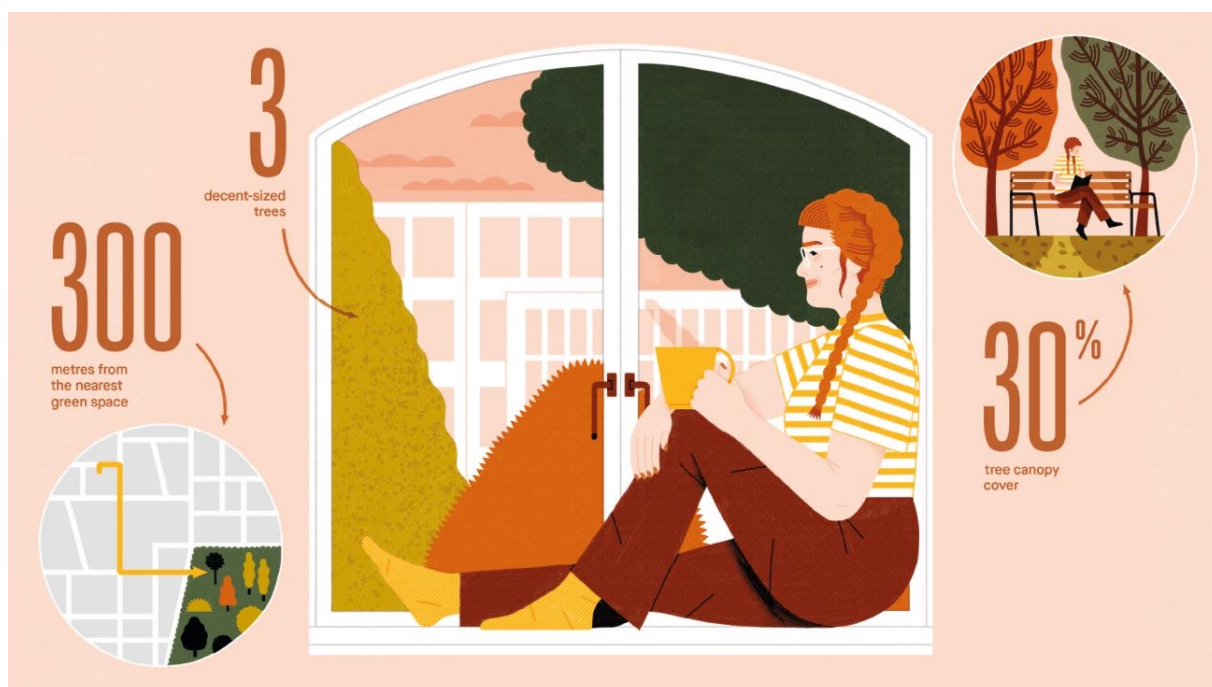
Illustration by Montse Galbany / The University of British Columbia

Projektet kan begyndes nu, og beplantningen skal være fuldført inden for 10 år.